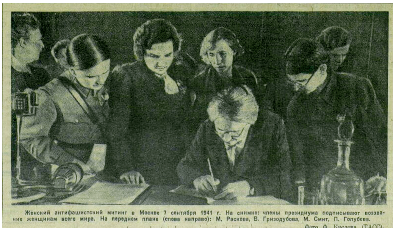
Женский антифашистский митинг в Москве 7 сентября 1941 г. На снимке: члены президиума подписывают воззвание женщинам всего мира. На переднем плане (слева направо): М. Раскова, В. Гризодубова, М. Смит, П. Голубева.

Глубокое понимание своего интернационального долга, сознание необходимости объединить усилия советских женщин с женщинами других стран участники Митинга выразили в Обращении «К женщинам мира». Из Москвы раздался страстный, пламенный призыв подняться на борьбу против фашизма.