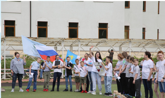
Готовимся к веселой эстафете «Папа, мама, я - дружная семья»