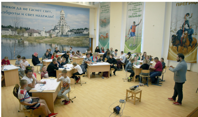
Главное событие программы - интерактивный тренинг «Моя жизнь - мой социальный проект»