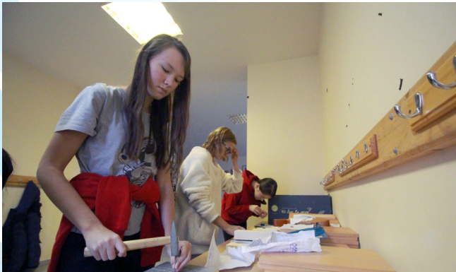
Одна из сестер Перовых показала свое виртуозное умение... забивать гвозди