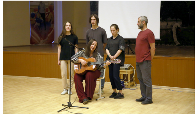
Семья Лягиных дарит всем участникам свою песню