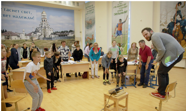
«Учиться надо весело, чтоб хорошо учиться!». Веселая игра-разминка на тренинге совсем не лишняя.