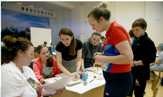
Мастер класс по изготовлению мотивационных досок захватил всех