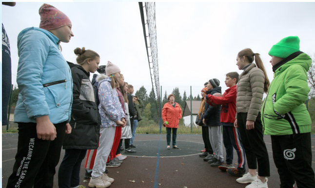
Нашлось время и для спортивного состязания: команда юношей против команды девушек. Угадайте, кто победил?