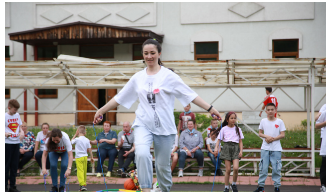
Первые старты и первые победы.