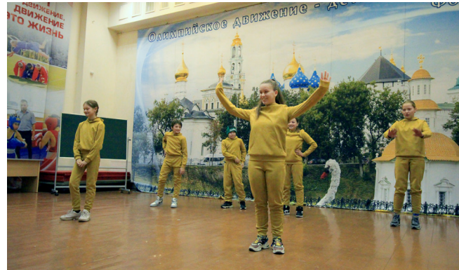
А кто-то был оригинален в организации досуга и творчестве в приеме гостей