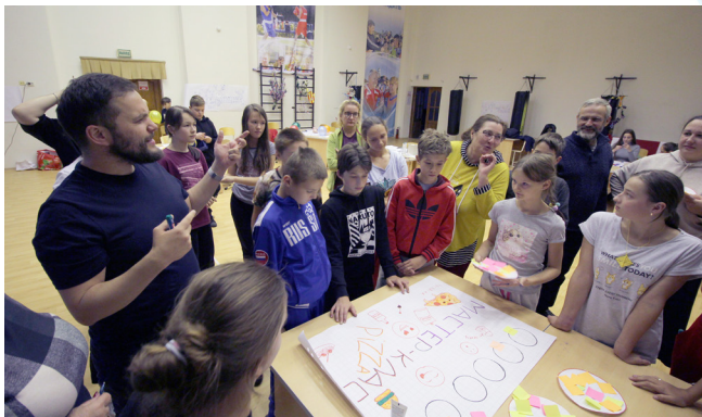
И вновь работаем над проектом. На этот раз проектное творчество проходит под девизом «Сделай шаг мечте на встречу»