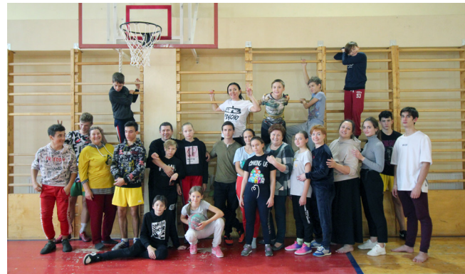
С не меньшим азартом в игру «Пионербол» включились мамы и папы.

Здесь победила дружба. Доказательство тому - общая фотография спортивных команд.