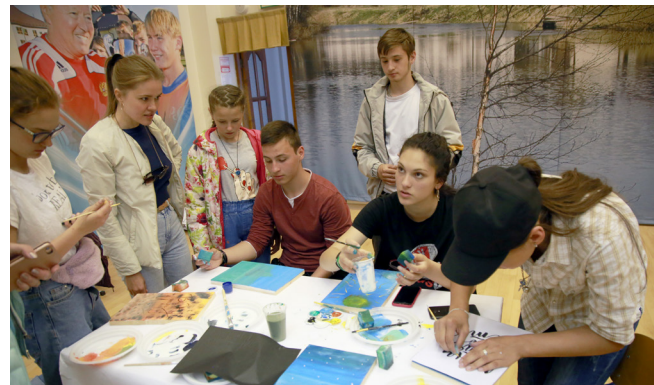
И как здорово работать, помогая и советуя друг другу!