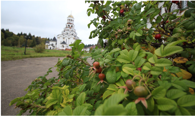
Нас снова принимает Православный Центр образования им. Сергия Преподобного