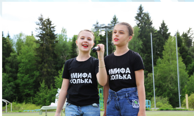
Замечательный девичий дуэт - украшение церемонии открытия