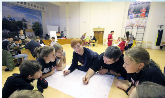
А как поживают «братцы-кролики»? Кто был с нами, тот поймет о чем это. Для остальных - пусть останется загадкой...