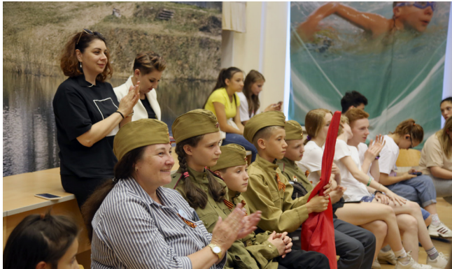
Первый вечер - вечер знакомства, положивший начало крепкой дружбы.