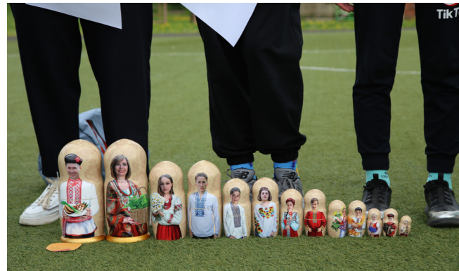
Угадайте, чья семья?