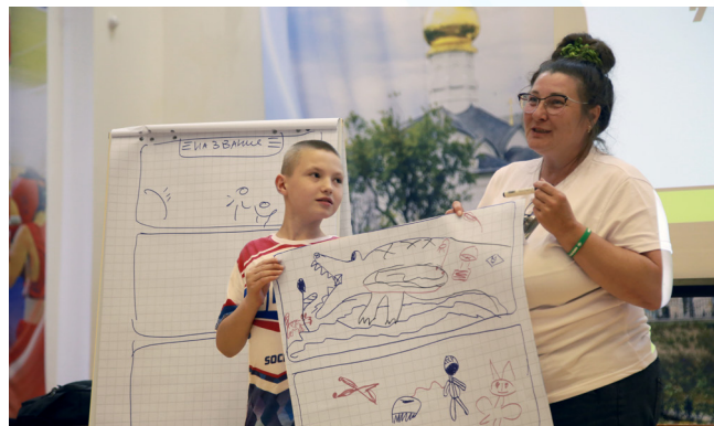
Презентовать свой проект - дело непростое