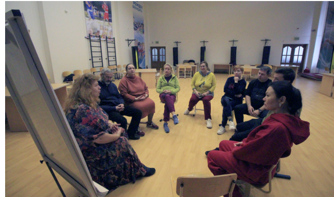
...не только ребятам, но и родителям