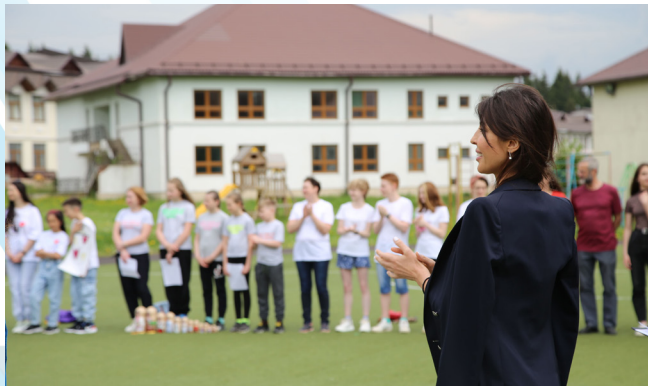
Линейка открытия программы «Жизнь как социальный проект»