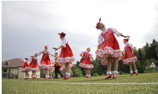
Задорный танец для всех участников