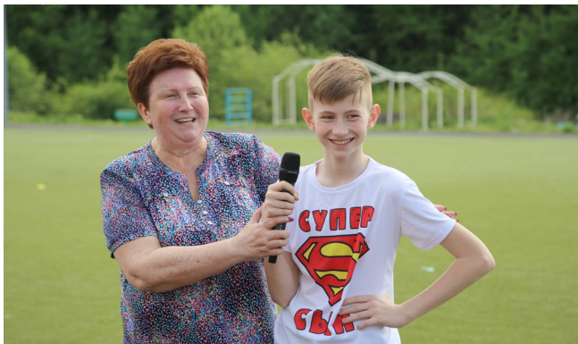
Первое выступление перед большой аудиторией