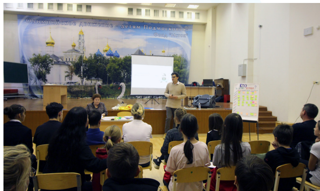
Полезные советы помогут нам избежать ошибок и быстро сориентироваться, если к нам обратятся мошенники