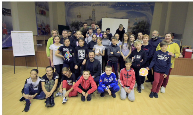
Тренинг завершился. Кто-то побежал собираться... Кто-то спешно об- менивается контактами... А кто-то все же решил сфотографироваться