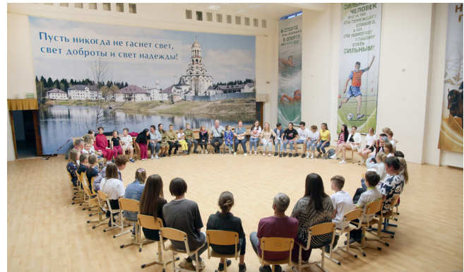
Вечерний круг - откровенный разговор по итогам дня: что запомнилось, какие открытия сделал, кому хочешь сказать спасибо...